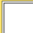
Arnaud FERAUX 23/10/2018 R0